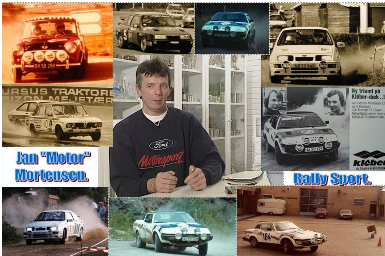
Gammelt avisudklip fra 1975.