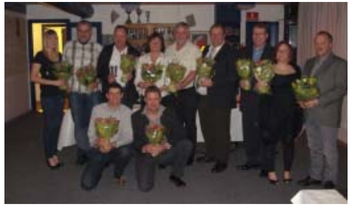
Præmietagerne i henholdsvis Bane- & O/R-afdelingerne!