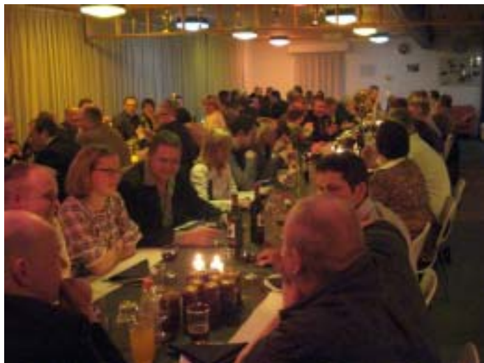
De feststemte deltagere!

Min fest startede hjemme hos mine „forældre“, hvor snakken gik og øl blev drukket inden bussen kom og hentede os. I klubhuset var der allerede mødt mange op, og i år deltog rigtig mange til årets fest – det var en fornøjelse at se. Det er jo altid lidt sjovere – jo flere vi er.