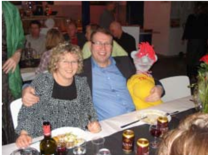
Her er jeg kommet i godt selskab!

Der sker mange ting til festen – både noget som vi altid skal (=plejer), og noget vi ikke plejer – vil lige nævne noget af det (jeg kan altså ikke følge med i det hele):