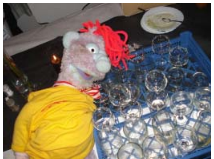
Pyhhh....en hård fest!