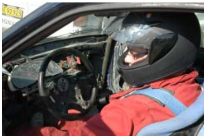
Så er jeg klar til race!

Der vinkes frem og bilen bliver sendt afsted med hvinende dæk