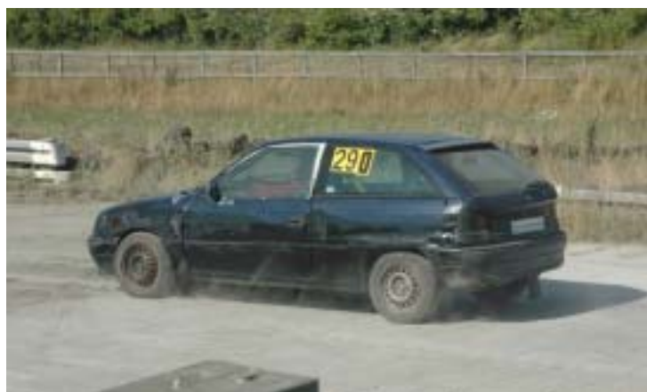
Afsted med gaspedalen i bund!

Fuld fart hen mod første sving og vride i rattet....nå, den er nok lidt livlig med bagenden....wow, skal vi allerede dreje igen! Så går det op mod et af de nyasfalterede sving på Nørlundbanen, hvor dækkene hyler da de pludselig får mere greb. Bilen er i konstant bevægelse.....højre, venstre og ligeud.