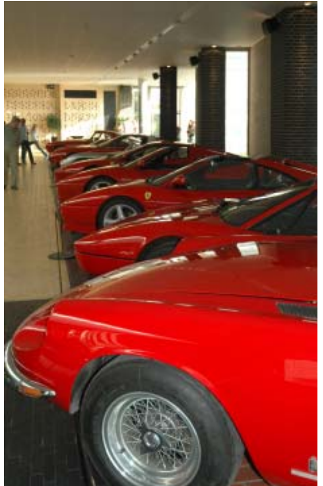
Lækre Ferrarier på rad og række!

Samlingen tæller adskillige Ferrarier...både gadebiler og gamle racersportsvogne, racervogne fra Jaguar, Aston Martin, Mercedes, Bugatti, Bentley, Alfa Romeo, Ford GT40, som ofte startes op, så publikum kan høre de kraftige motorer. Således var samlingens Ferrari 250 GTO netop på værksted, fordi den ikke havde kunnet holde til de mange koldstarter, og skulle laves for Kr. 100.000,-