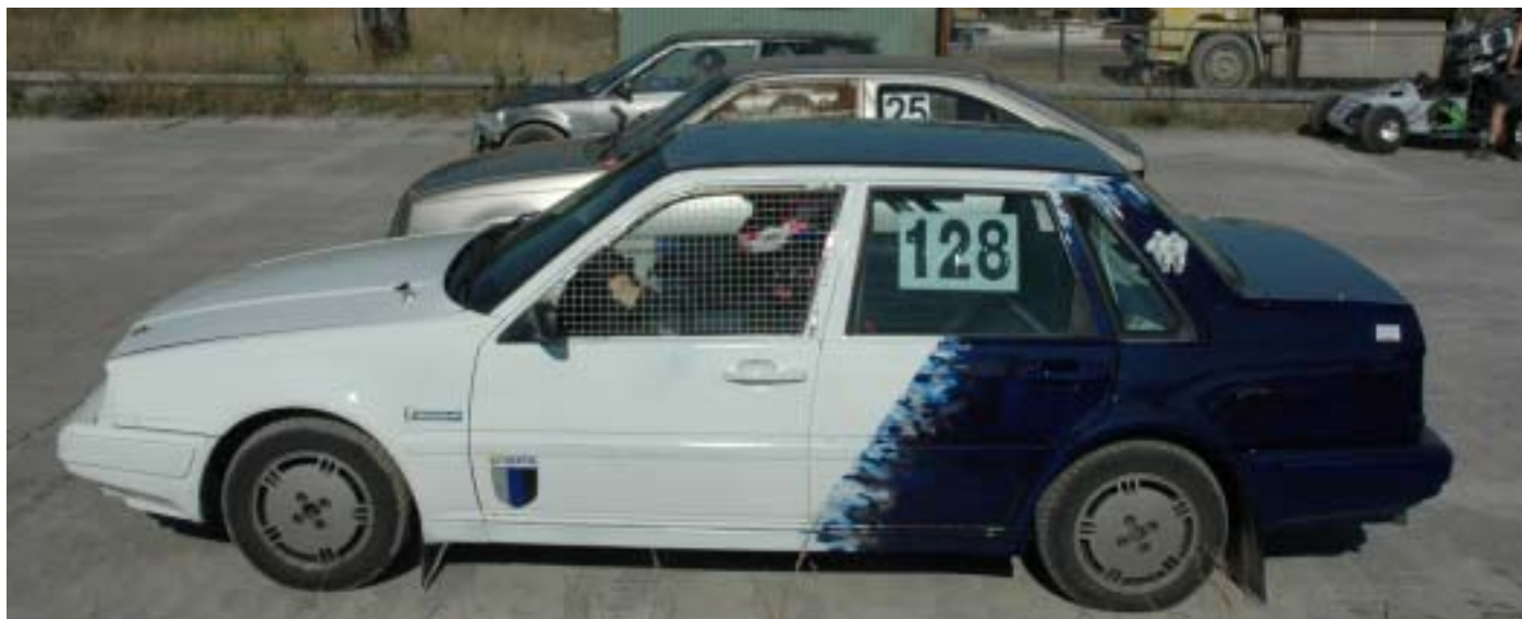
Dagens flotteste Folkeracer tilhørende 2 af mine medkursister, som deltes om bilen....ikke helt problemfrit!

Da der var en del som skulle tage baneprove blev vi opdelt i 2 hold. Da jeg var på hold 2 kunne jeg således studere de øvrige, og se hvordan det foregik.