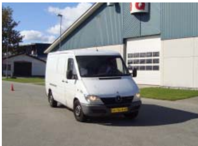
Bo opnåede en 2.plads i den store Mercedes... slalom er ikke lige dens livret!