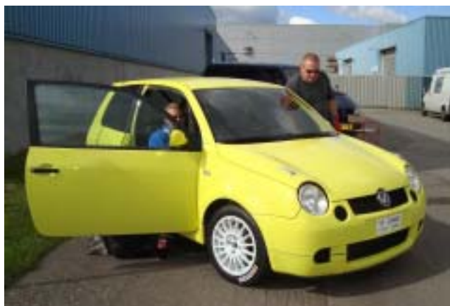
Per havde fået Lupo'en klar! En spændende bil, som tidligere har kørt baneløb!