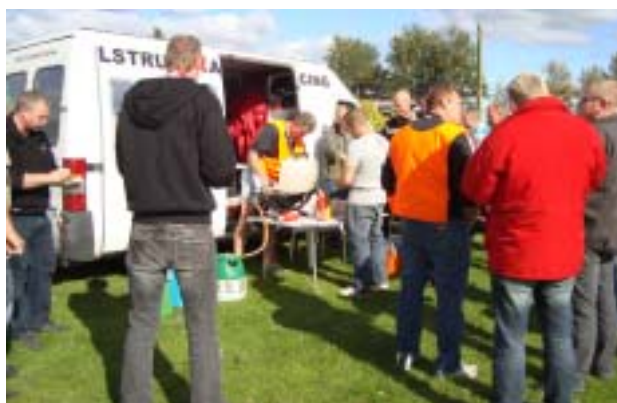
Én ting kan man i hvert fald blive enige om!..... Grillpølser SKAL der til!