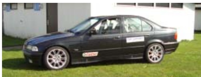
Peter & Claus er netop blevet færdige med den flotte BMW. Den skal køres anderledes end Peugeot'en skulle!