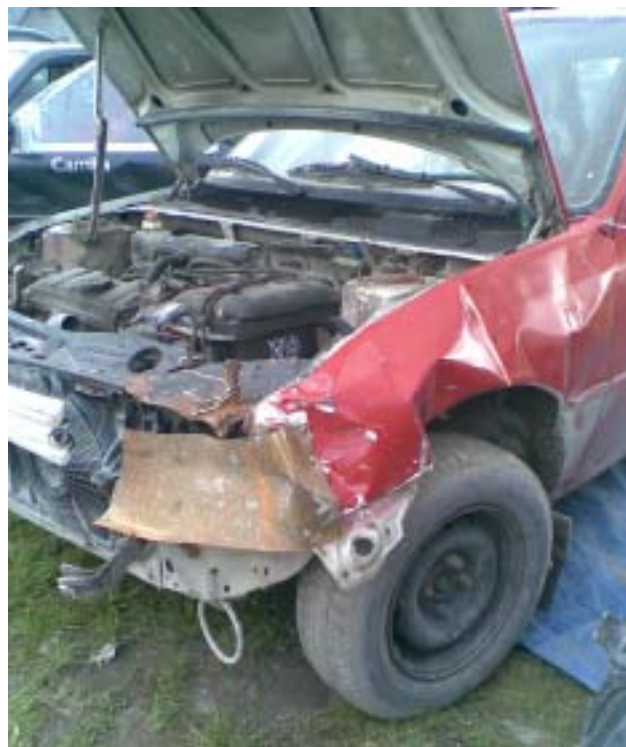
Sådan på Peugeot'ens front ud efter mit møde med autoværnet...heldigvis kunne den stadig køre!

På dagen var jeg naturligvis mødt tidligt op, som belært under licenskurset, men det var da tydeligt at se at det var længe siden de øvrige havde været på et sådan kursus.....eller også var de bare mødt så tidligt dagen før, at det var blevet ret sent!!!! Der kom dog efterhånden gang i tingene, og bilerne og kørerne begyndte efterhånden at dukke op.