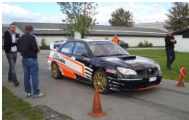
Nicolai var ikke uventet suveræn hurtigst!