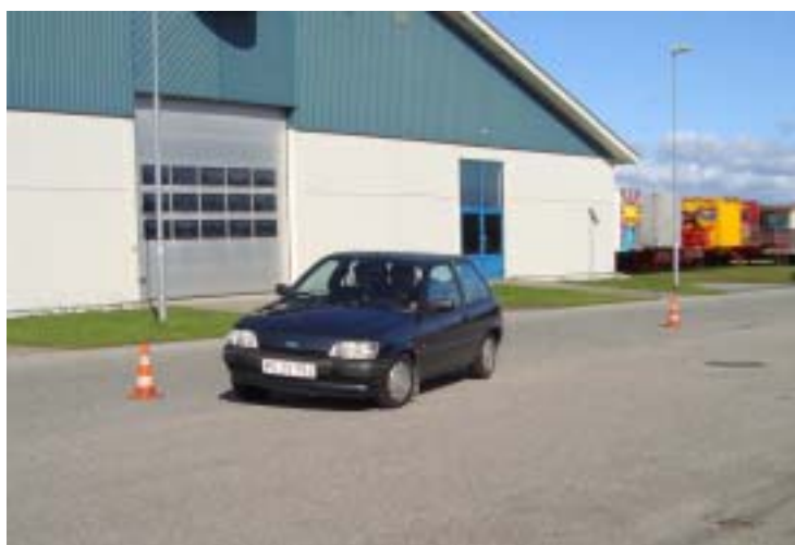
Henrik havde i dagens anledning fået lov at låne Charlottes Fiesta....hun indtog 2.kørersædet og de blev nr. 3 kun et enkelt sekund fra 2. pladsen!