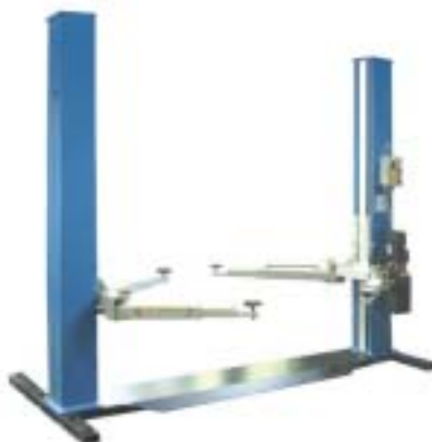
Liften er en OMA 511 på ca. 37.000kr