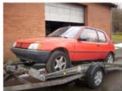
Autotrailer er en meget god ting. I skolen blev der brugt en, fra en 30 år gammel bil. Men på grund af en af dem der var det stadigvæk.