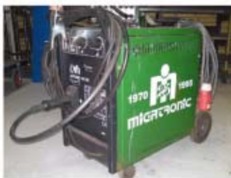
Støjsvejsen er en tidligere søgning af bilen, 27 år tidligere model (egnet til biler indtil)

Hvis der er nogle, der vil hjælpe os med at få tingene tilbage, kan I prøve at se på billederne herunder.