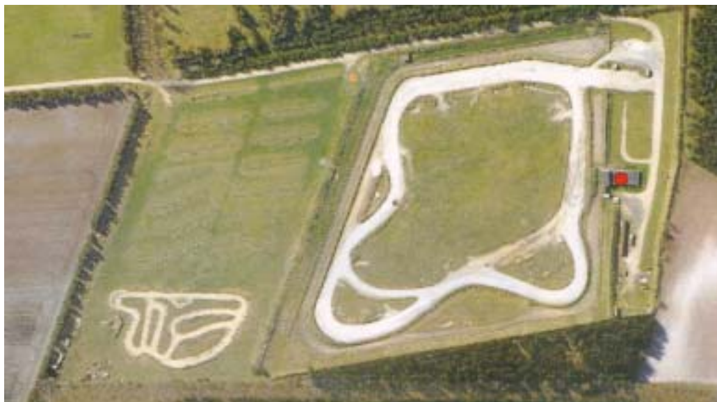
Et lidt ældre luft foto der viser „Nørlund Race Center“!..... Det er MRC-banen til venstre!

Så markér allerede datoen i kalenderen nu og vær med til at gøre denne dag til en festdag.