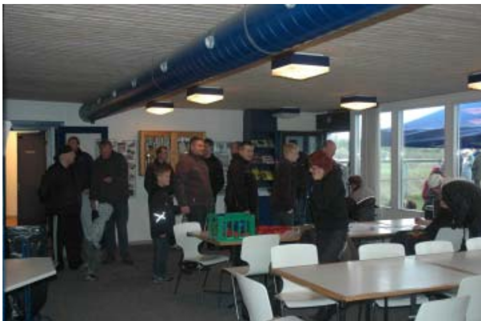
Folk stod allerede fra morgenstunden i kø for at komme ud at køre i en Folke-racer!

Her er det så at jeg syntes det er på sin plads at takke de forskellige kørere, officials og andre hjælpere som selv ser at det „brænder lidt på“ og så tager initiativ til at hjælpe. For mit eget vedkommende mærkede jeg det hurtigt, da flere kom og tilbød deres hjælp og andre bare hjalp hvor de kunne se der var „problemer“, og sådan tror jeg også det var tilfældet resten af vejen rundt.