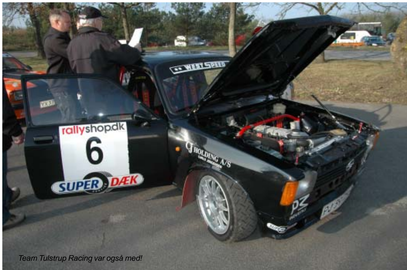
Team Tulstrup Racing var også med!