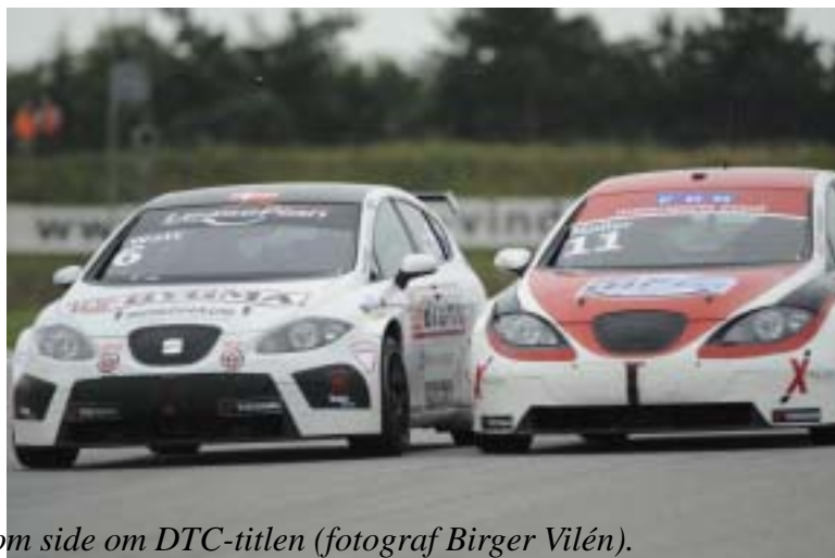
Jason Watt (6) og Jens Møller (11) kæmper side om side om DTC-titlen.